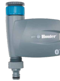
BTT-101 Einlaufdurchmesser: 3/4" und 1" Auslaufdurchmesser: 3/4" Höhe: 16,8 cm Breite: 12 cm Tiefe: 6 cm

Die Bluetooth® Wortmarke und Bluetooth® Logos sind registrierte Marken der Bluetooth SIG, Inc. iOS ist eine Marke oder registrierte Marke von Cisco Systems Inc. in den USA und weiteren Ländern. Android ist eine Marke der Google LLC. Die Nutzung dieser Marken durch Hunter Industries ist durch Lizenz gestattet.