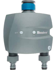
BTT-201 Einlaufdurchmesser: 3/4" und 1" Auslaufdurchmesser: 3/4" Höhe: 15,7 cm Breite: 13,5 cm Tiefe: 7,6 cm